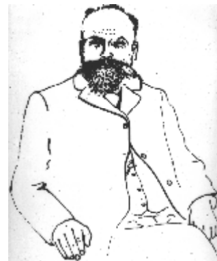
Abbildung 6 Hermann Schwartz (1837 – 1910)