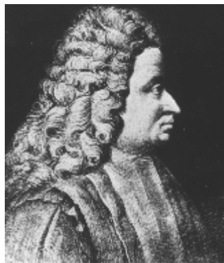
Abbildung 3 Antonio Maria Valsalva (1666 – 1723)