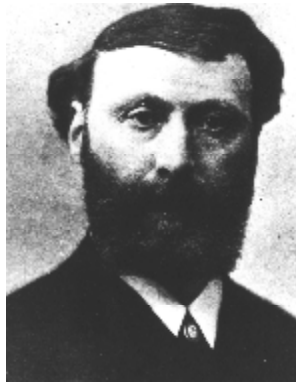
Abbildung 7 Adam Politzer (1835 – 1920)