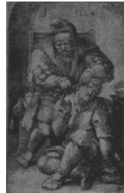
Abbildung 2 Mastoid- Operation (1524) retroaurikuläre Inzision