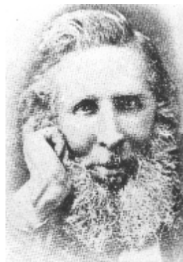
Abbildung 5 William Wilde 1853