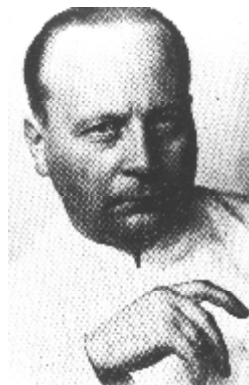
Abbildung 9 Horst L. Wullstein (1906 – 1987)