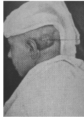
Abbildung 8 Z. n. otogener Komplikation (Anfang des 20. Jahrhunderts)